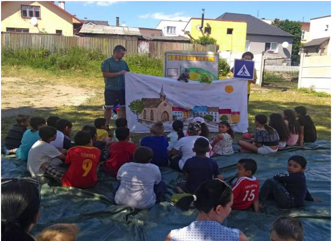
Kindertreff der Gemeinde Poprad-Matejovce

In der slowakischen Stadt Poprad am Fuße der Hohen Tatra befindet sich seit der Reformation eine evangelische Gemeinde im Ortsteil Matejovce. Dort leben viele junge Familien, in der Nähe der Kirche liegt eine Romasiedlung. Zum Kindertreff der Gemeinde kommen auch viele Romakinder. In diesem Umfeld sieht die kleine Gemeinde gute Chancen zu wachsen. Für alle missionarischen Aktivitäten ist es wichtig, das bisher nur notdürftig sanierte Gemeindezentrum herzurichten. Heizung und Elektrik müssen erneuert und alle Fenster ausgetauscht werden.