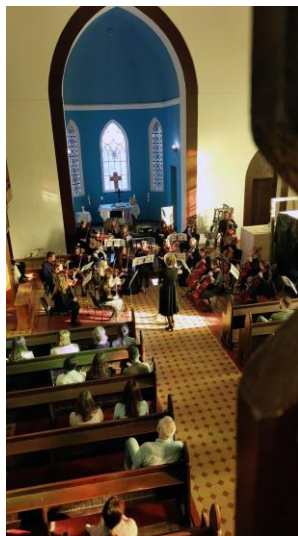
Gemeinde in Grodno in Belarus