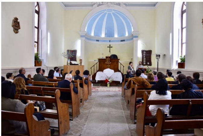
Die Waldenserkirche in Riesi auf Sizilien

Im 19. Jh. gewann die Waldenserkirche durch missionarische Tätigkeit auf Sizilien stark an Einfluss. Die über 120 Jahre alte Kirche in Riesi benötigt eine Erneuerung des Daches, der Zwischendecke und der Elektrik. Der aufwändigste Teil der Arbeiten ist die Entfernung und Entsorgung von Asbestplatten.