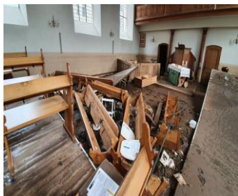
Hochwasserschäden in der Kirche von Schleiden

Im Zuge der starken Regenfälle im Juli 2021 auf dem Gebiet der Ev. Kirche im Rheinland, sind besonders die Gemeinden in der Voreifel und in Ahrweiler betroffen. Kirchen und Gemeindehäuser müssen unter hohen Kosten wieder instandgesetzt werden.